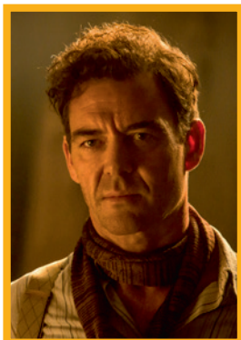
МАРТОН ЧОКАШ /Marton Csokas/ – Клаус

Родилась 23 октября 1986 года в Лондоне. Обучалась актерскому мастерству в Drama Centre London. Снималась в сериале «Игра престолов», в фильмах «Дом Хемингуэй», «До встречи с тобой», «Терминатор: Генезис». В 2013 году дебютировала на Бродвее в роли Холли Голайтли в спектакле «Завтрак у Тиффани».