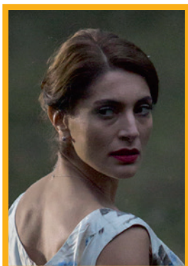
КАТЕРИНА МУРИНО /Caterina Murino/ – Мальвина

Родился 30 июня 1966 года в Новой Зеландии. Снимался в фильмах «Царство небесное», «Три икса», «Забывшие желания», «Властелин колец», «Великий уравнитель», «Город грехов-2: Женщина, ради которой стоит убивать», «Ной», «Дом грез».