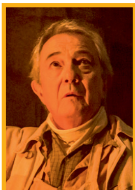
РЕМО ДЖИРОНЕ /Remo Girone/ – Алессио

Родилась 15 сентября 1977 года на Сардинии, Италия. Снималась в фильмах «Казино Рояль», «Любовь на троих», «Эдемский сад», «Жребий», «Антиганг».