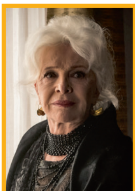
ЛИЗА ГАСТОНИ /Lisa Gastoni/ – Лилия

Родился 1 декабря 1948 года в Эритрее. Снимался в сериалах «Спрут», «Фантагино», «Еретик», в фильмах «Чемоданы Тульса Люпера», «Бандиты», «Рай», «Персона нон грата», «Закон ночи».