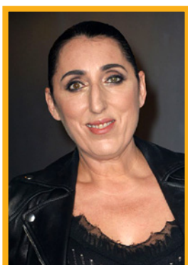
РОССИ ДЕ ПАЛЬМА /Rossy de Palma/ – Мария

Родилась 5 апреля 1970 года в Сомене, Франция. Снималась в фильмах «Мужчина моей жизни», «Салон магии», «Любовь зла», «Бутик», «Маленькие секреты», «Первая любовь», «Каникулы на море», «Никогда в жизни», в телесериалах «Новеллы Ги де Мопассана», «Романист Мартен».