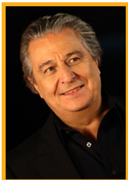
КРИСТИАН КЛАВЬЕ /Christian Clavier/ – Мишель Лепру

Родился 6 мая 1952 года в Париже. Снимался в фильмах «Загорелые», «Загорелые на лыжах», «Дед Мороз – отморозок», «Пришельцы», «Пришельцы-2: Коридоры времени», «Астерикс и Обеликс против Цезаря», «Пришельцы в Америке», «Астерикс и Обеликс: Миссия Клеопатра», «Святая Викторина», «Безумная свадьба», в сериалах «Наполеон», «Отверженные» (2000).