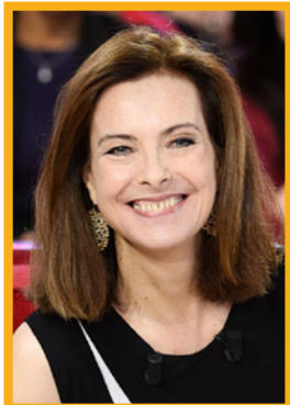
КАРОЛЬ БУКЕ /Carole Bouquet/ – Натали Лепру

Родился 6 мая 1952 года в Париже. Снимался в фильмах «Загорелые», «Загорелые на лыжах», «Дед Мороз – отморозок», «Пришельцы», «Пришельцы-2: Коридоры времени», «Астерикс и Обеликс против Цезаря», «Пришельцы в Америке», «Астерикс и Обеликс: Миссия Клеопатра», «Святая Викторина», «Безумная свадьба», в сериалах «Наполеон», «Отверженные» (2000).