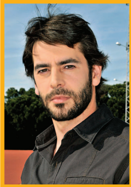
ЭДУАРДО НОРЬЕГА /Eduardo Noriega/

Родился 16 января 1957 года в Буэнос-Айресе. Снимался в фильмах «Девять королев», «Сын невесты», «Камчатка». Сыграл главную роль в ленте «Тайна в его глазах», награжденной премией «Оскар» в категории «Лучший иностранный фильм».