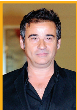
ЭДУАРД ФЕРНАНДЕС /Eduard Fernández/

Родился 1 августа 1973 года в Кантабрии, Испания. Снимался в фильмах «Хребет дьявола», «Открой глаза» (номинация на премию Goya), «Че Гевара», «Дар», «Транссибирский экспресс», «Волк» (номинация на премию Goya), «Точка обстрела».