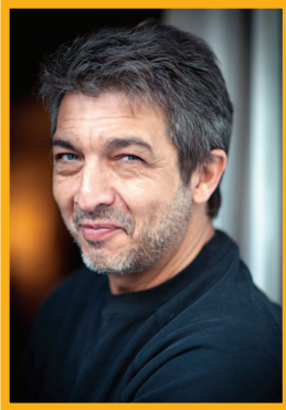
РИКАРДО ДАРИН /Ricardo Darín/

Родился 16 января 1957 года в Буэнос-Айресе. Снимался в фильмах «Девять королев», «Сын невесты», «Камчатка». Сыграл главную роль в ленте «Тайна в его глазах», награжденной премией «Оскар» в категории «Лучший иностранный фильм».