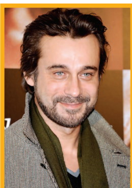
ХОРДИ МОЛЬЯ /Jordi Mollà/

Родился 13 октября 1971 года в Луго, Испания. Снимался в фильмах «Убить Фрейда», «Мистер Ганджубас», «Камера 211» (премия Goya, номинация на премию Европейской киноакадемии), «Все еще впереди» (номинация на премию Европейской киноакадемии), «Возьми мои глаза» (премия Goya, призы МКФ в Сан-Себастьяне и Сиэтле), «Солнечные понедельники» (премия Goya).