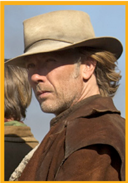
МИКАЭЛЬ ПЕРСБРАНДТ /Mikael Persbrandt/ – Питер

Родился 22 апреля 1966 года в Сиэтле. Снимался в сериалах «Крутой Уокер», «Скорая помощь», «Анатомия страсти», «Сверхъестественное», в фильмах «Шкатулка проклятия», «Хранители», «Шанхай», «Лузеры», «Дни гнева», «P.S. Я люблю тебя», «Шесть» и других.