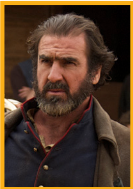
ЭРИК КАНТОНА /Eric Cantona/ – Корсиканец

Родился 1 июня 1947 года в Холивелле, Уэльс, Великобритания. Окончил Королевскую академию драматического искусства в Лондоне. Играл в Королевской шекспировской труппе и на бродвейской сцене. Обладатель театральных премий – имени Лоуренса Оливье и «Тони». В 1996 году награжден призом за лучшую мужскую роль на Каннском МКФ («Каррингтон»). Также снимался в фильмах «Гленгарри Глен Росс», «Бразилия», «Братья Гримм», «Ронин», «Эвита», «Завтра не умрет никогда», «Стигматы» и других.