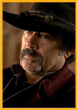
ДЖЕФФРИ ДИН МОРГАН /Jeffrey Dean Morgan/ – Делару

Родилась 6 июля 1980 года в Париже. Дочь знаменитой французской актрисы Марлен Жобер. Прославилась сразу после кинодебюта в драме Бернардо Бертолуччи «Мечтатели» (2003). Снималась в фильмах «Арсен Люпен», «Царство небесное», «Казино Рояль», «Франклин», «Последняя любовь на Земле», «300 спартанцев: Расцвет империи», «Мрачные тени», «Город грехов-2: Женщина, ради которой стоит убивать». В 2007-м награждена премией BAFTA «Восходящая звезда».