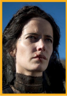
ЕВА ГРИН /Eva Green/ – Мадлен

Родилась 6 июля 1980 года в Париже. Дочь знаменитой французской актрисы Марлен Жобер. Прославилась сразу после кинодебюта в драме Бернардо Бертолуччи «Мечтатели» (2003). Снималась в фильмах «Арсен Люпен», «Царство небесное», «Казино Рояль», «Франклин», «Последняя любовь на Земле», «300 спартанцев: Расцвет империи», «Мрачные тени», «Город грехов-2: Женщина, ради которой стоит убивать». В 2007-м награждена премией BAFTA «Восходящая звезда».